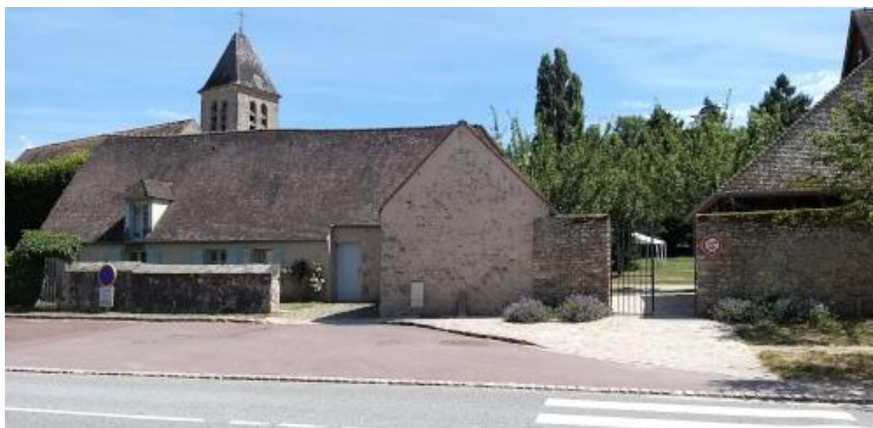
Vue côté Grande rue

Le bâtiment doit faire l'objet de travaux d'amélioration sur le plan thermique (isolation et chauffage) et d'aménagements pour la nouvelle activité de café-restaurant. L'ensemble de ces travaux seront financés par la mairie. Les aménagements seront définis en concertation avec le candidat retenu. Une terrasse sera créée du côté du parc municipal.