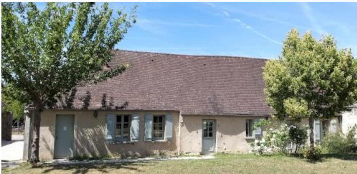
Vue côté Parc municipal